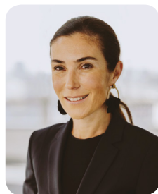
#SNCF Gares & Connexions

Directrice Générale SNCF Gares & Connexions